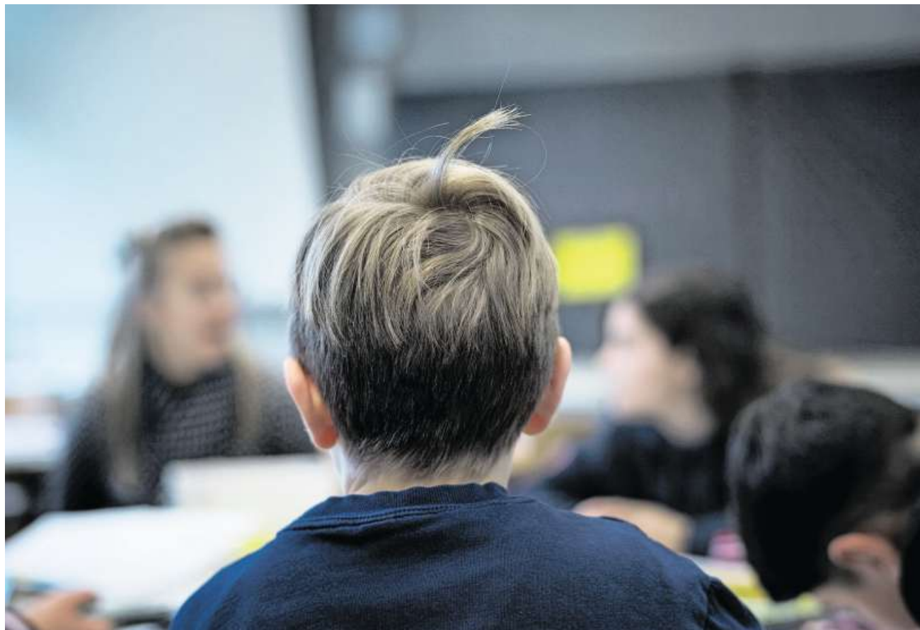
Heute besuchen fast alle Kinder den Regelunterricht. Der Bevölkerung passt das nicht.

Die Parteizugehörigkeit der Befragten spielt bei der Beantwortung der Frage eine entscheidende Rolle. Ledig-