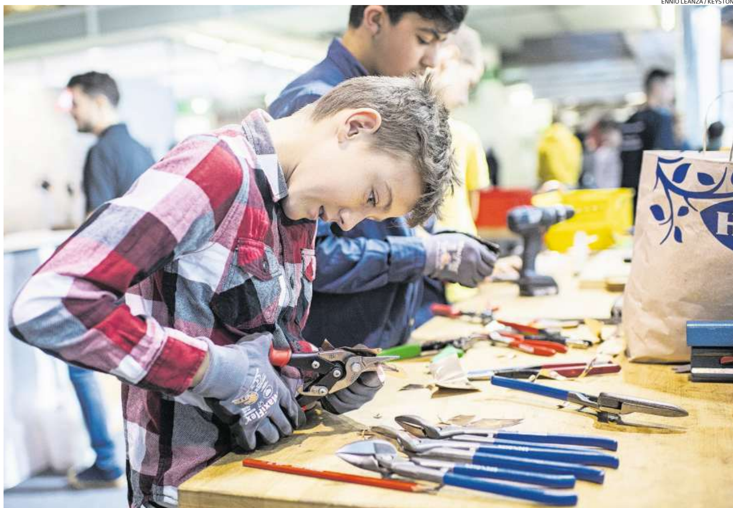
Lücken im Zeugnis erschweren die Lehrstellensuche: Jugendliche an der Berufsmesse Zürich. (19. November 2019)

Zehntausende Kinder erhalten in einzelnen Fächern keine Noten. Das entlastet sie zwar kurzfristig, führt aber zu Problemen in ihrem Leben als Erwachsene